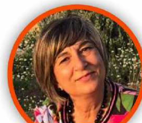
GIOVANNA MARIA BURRELLI SCUOLA PRIMARIA